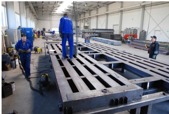
Na tym etapie wagi są spawane