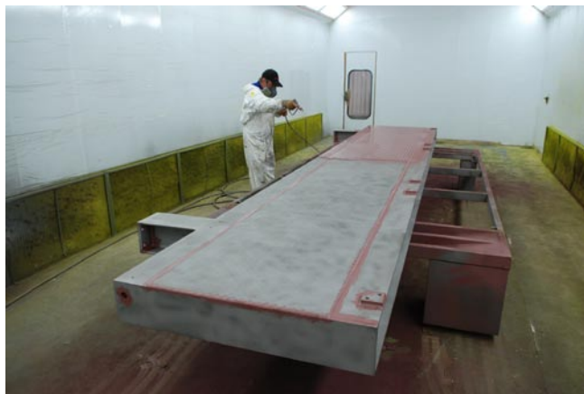
Lakierowanie wagi w komorze lakierniczej