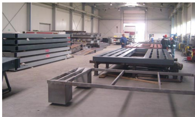
Wnętrze hali produkcyjnej. Na zdjęciu z prawej widoczna jest 8-tonowa suwnica

Budowa jednej wagi zajmuje ok. 2 tygodni (w zależności od jej gabarytów). Używa się do tego najwyższej klasy komponentów, m.in.: tensometrycznych czujników niemieckiej firmy Flintec wykonanych w klasie dokładności GP, C1, C3, C4. Następnie waga jest pakowana na przyczepę, dowożona do klienta i montowana. Wszystkie wagi posiadają certyfikat zatwierdzenia typu Wspólnoty Europejskiej i speł-