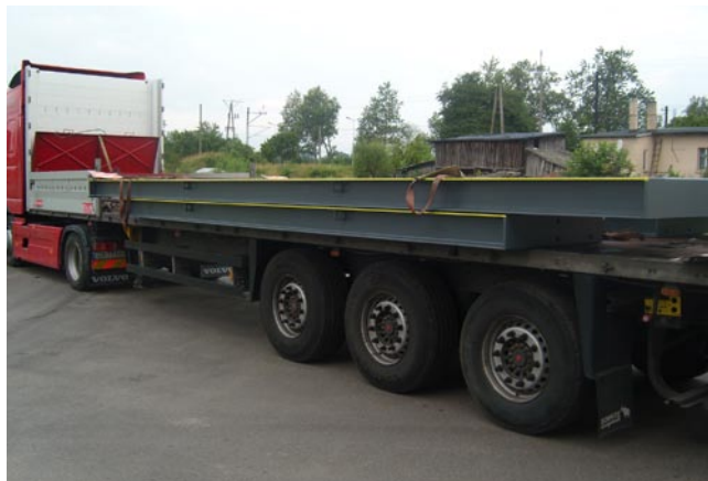
Gotowe wagi dostarczane są do klientów transportem samochodowym

swojego przedsiębiorstwa odpowiada: „Chyba to tempo wzrostu, które udało nam się utrzymać i doprowadzić do pułapu, który nas zadowala i pozwala zachować płynność finansową”.